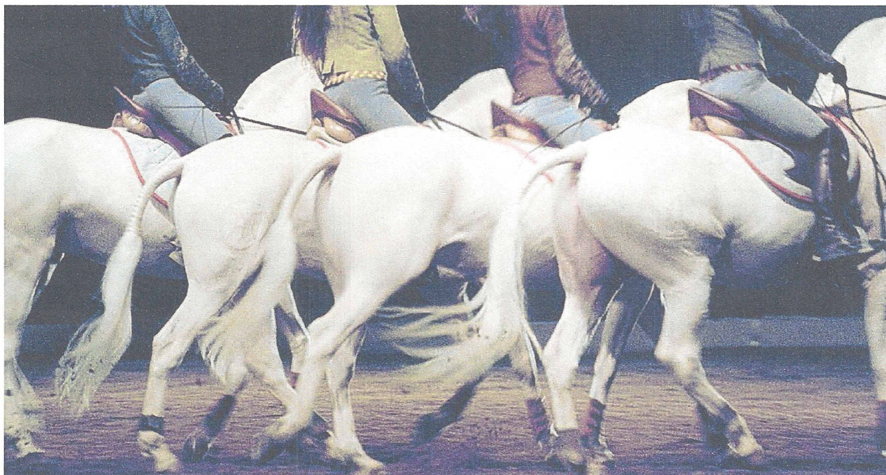
Die neue Inszenierung der „Académie du Spectacle Equestre“ kommt ins Saarbrücker E-Werk.

Saarbrücker Zeitung 4. Juni 2009 165.000 Regionale Tagespresse